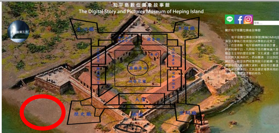
*和平島數位故事館網頁主頁面