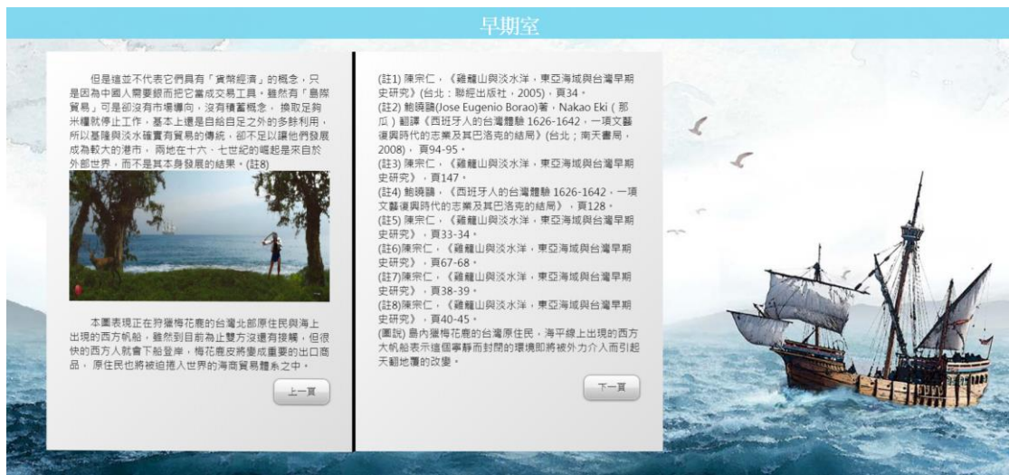
*透過翻閱電子書的概念來閱讀詳細資訊