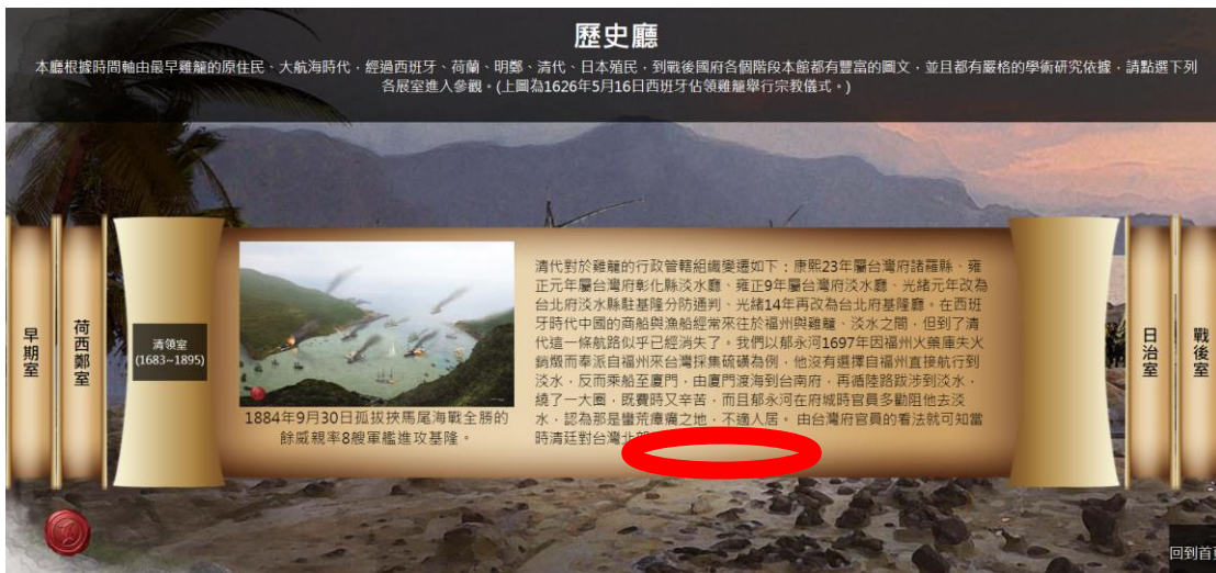
*滑鼠放置卷軸會打開各室(時期)的簡介，未來紅框地方會建置詳細資訊的按鈕以作跳轉詳細資訊頁面如下圖示意