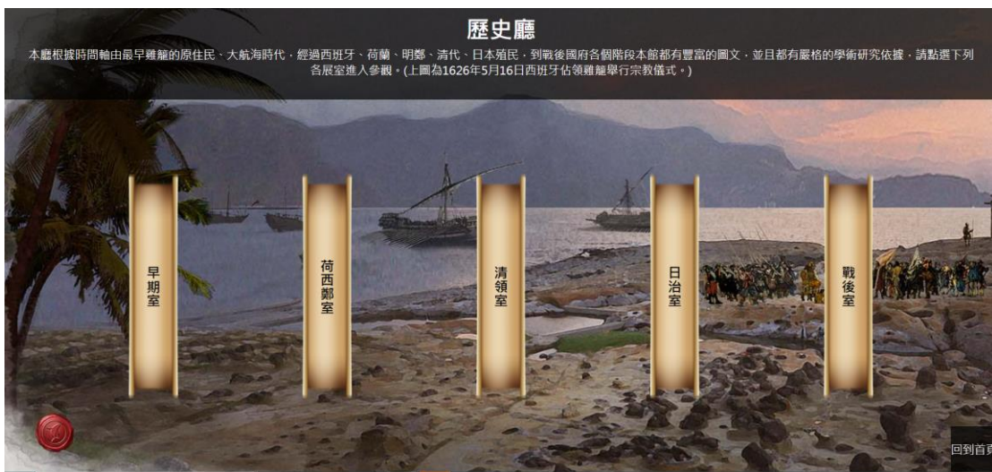
*未來點選紅框部分可連至下圖歷史發展廳頁面