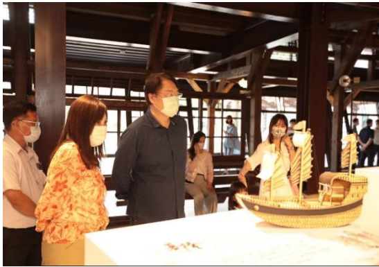
基隆市長與文化局長觀展